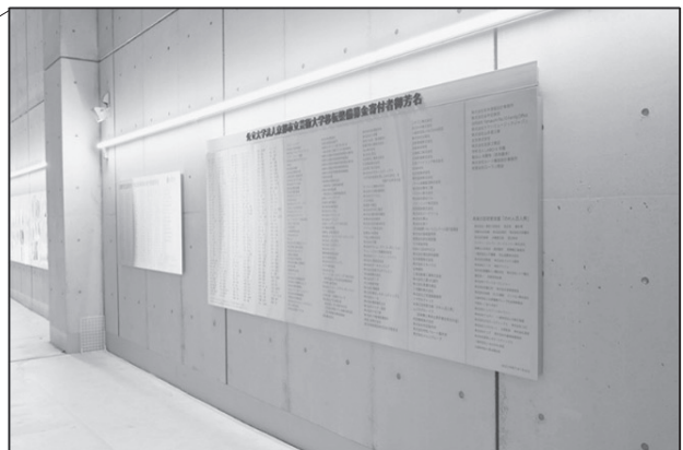
B 棟 1 階壁面